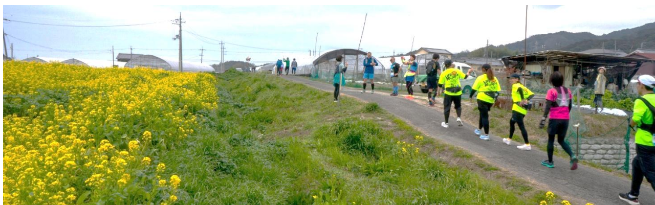
(昨年のマラニックイベントの写真)

フィニッシュ後は奈良マラソン推奨温泉「天然湧出温泉 ゆららの湯」でゆっくりと疲れを癒していただけます。