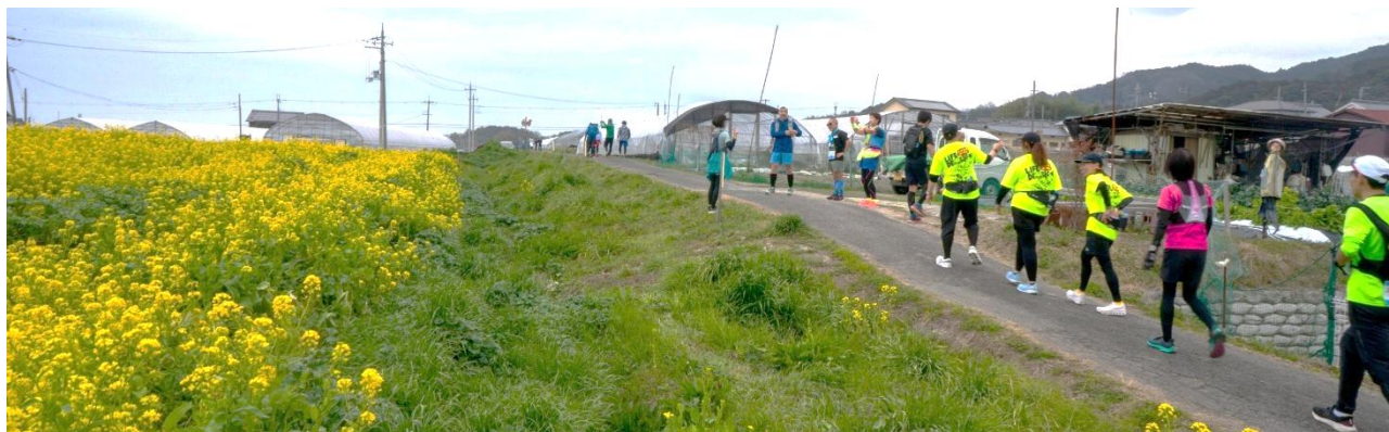
(マラニックイベントの写真)

フィニッシュ後は、奈良マラソン推奨温泉「天然湧出温泉 ゆららの湯」でゆっくりと疲れを癒していただけます。