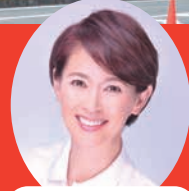
スペシャルゲスト 有森裕子さん